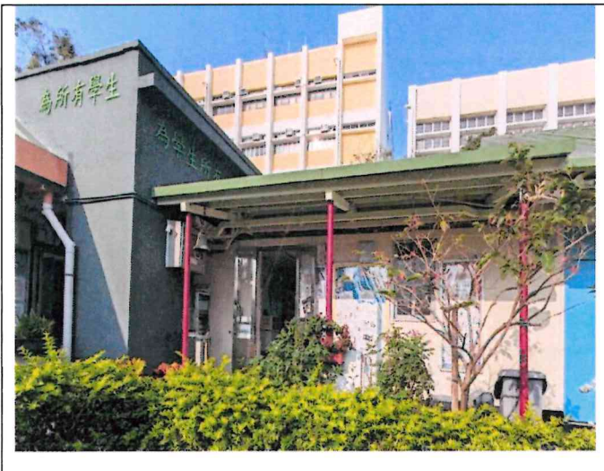
項目2：校務處內牆(對校內)